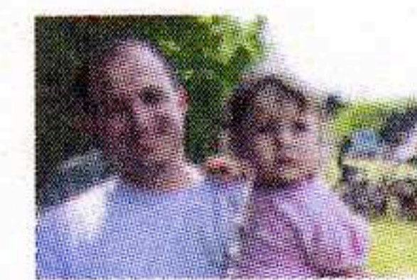
Legendäres Sommerfest der Feuerwehr 25.05.2008