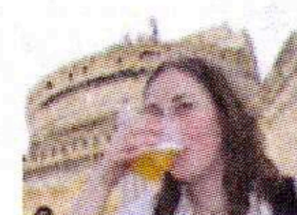
Altmühldorfer Blaskapelle in Rom 25.05.2008