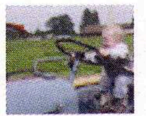
Tag der Landwirtschaft 25.05.2008