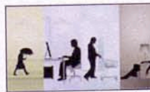
Animationen Teil 1, hosted by SPIEGEL ONLINE

Panopti.com - Die schöne neue Welt der Überwachung: So anschaulich wie nur selten macht die Flash-Präsentation des Designers Johannes Widmer klar, dass das Thema Datenschutz uns alle angeht. Beispielhafte Flash-