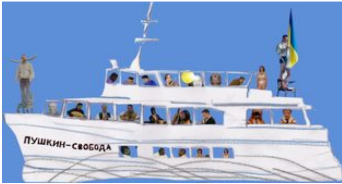
Yuri Leiderman Installation zur Ausstellung "Die Ehre hüt von Jugend auf" Ausstellung und Performance des Museum Folkwang im RWE Turm, Essen 2009